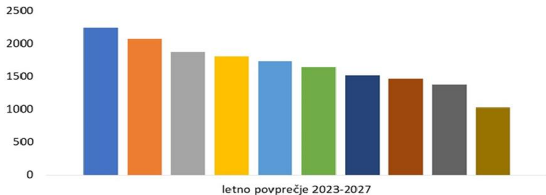
Poklici z največjim številom prosih delovnih mest