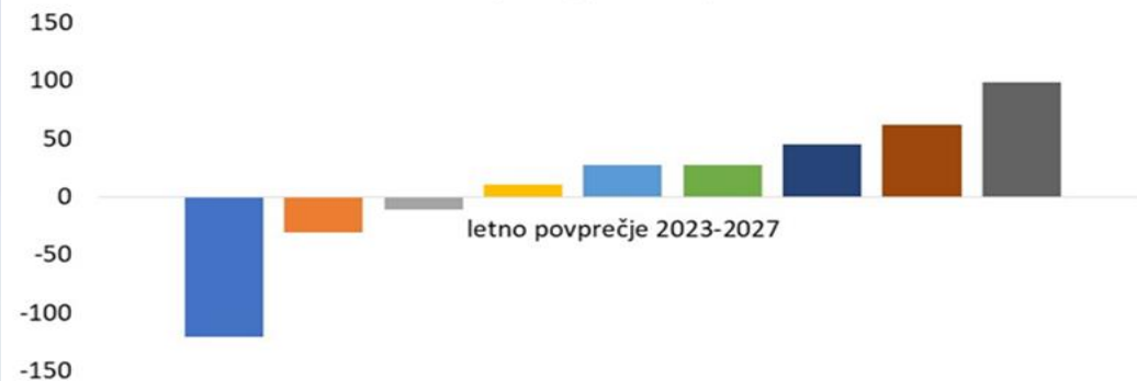
Poklici z najmanj potreb po kadrih