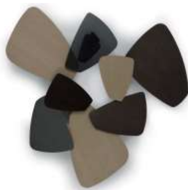
Slike produkta: Kamnita miza

Tehnične karakteristike Kamnite mize so: