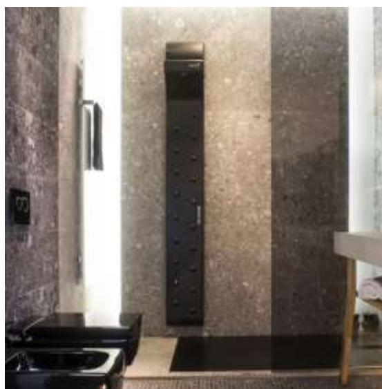
Slike produkta: VALIRYO®